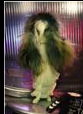
Frimousse 2010 Chloé