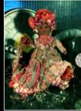
Frimousse 2010 Antik Batik