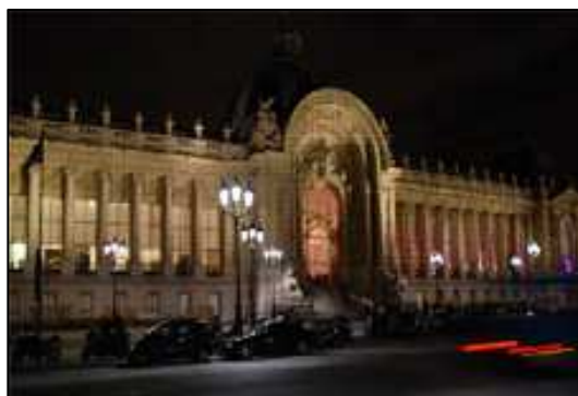
Le Petit Palais

Dirigeant de « La Mode en image », il est l'organisateur du spectacle du bicentenaire au Champs de Mars (1989), des cent ans de la Tour Eiffel (1989), de la finale de la coupe du Monde de Football à Paris (1998), du 100 e anniversaire du magasin Cartier à Paris (1999) et travaille également avec d'autres grandes maisons de couture.