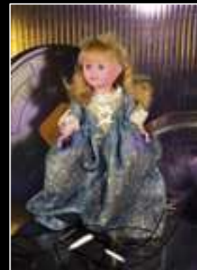
Frimousse 2010 Au Nain Bleu