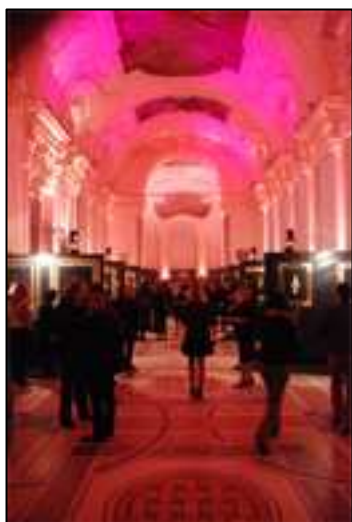
Le vernissage au Petit Palais, Edition 2009