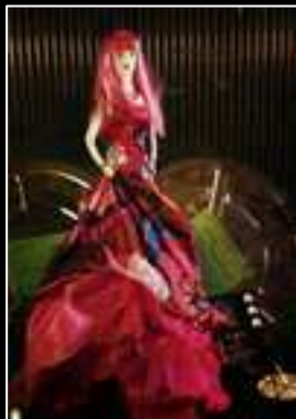
Frimousse 2010 Chacok