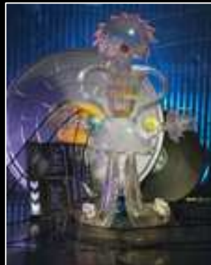
Frimousse 2010 Chantal Thomass