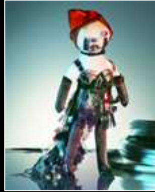
Frimousse 2010 Jean-Paul Gaultier