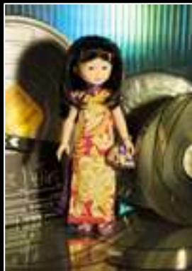
Frimousse 2010 Léonard