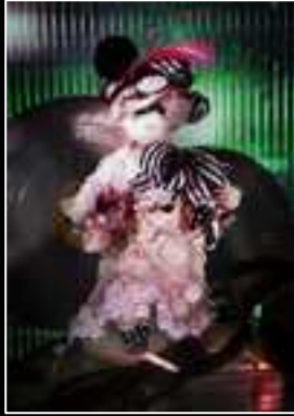
Frimousse 2010 Maison Lesage