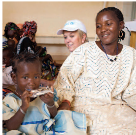
▲ « Hopital de Kaya : ici, les enfants reprennent des forces grâce au Plumpy'nut® ».