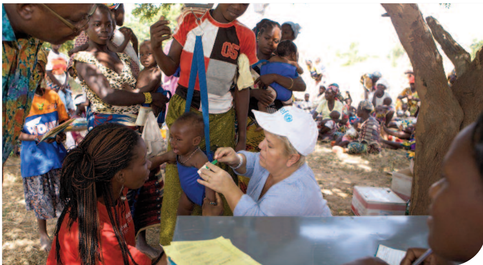
▲ « J'ai pris la mesure du bras. Je n'avais pas conscience que c'était important, qu'un enfant malnutri pouvait avoir le bras si maigre. »

grâce à un simple bracelet qui mesure leur tour de bras (périmètre brachial), pour déterminer le degré de malnutrition (voir encadré). Mimie Mathy a assisté à l'une de ces séances. Elle témoigne : « Le bras est un indice très fort pour dire : Attention, si l'enfant ne prend pas plus de poids, il doit passer au centre nutritionnel et c'est pour son bien ! ». Cette approche à base communautaire consiste en effet à détecter en temps voulu, dans les villes mais aussi dans les villages les plus reculés, les cas de malnutrition aiguë sévère et lorsqu'il n'y a pas de complications médicales, à fournir un traitement composé d'aliments thérapeutiques prêts à l'emploi administré à domicile. Les enfants souffrant de complications médicales sont dirigés vers des structures de soins, comme l'hôpital de Kaya.