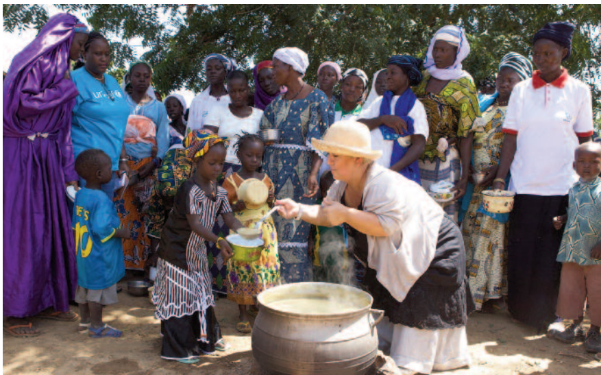
▲ « Pendant près d'une semaine, j'ai été au contact de gens dans le besoin qui vont de l'avant. Ici, point de résignation, mais l'envie de s'en sortir ».