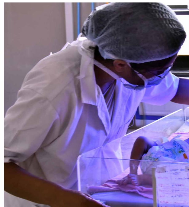
Un nouveau-né reçoit des soins à l'hôpital civil de Beed, dans l'État du Maharashtra au centre-ouest de l'Inde. >

« Nous sommes censées être au moins cinq sages-femmes en temps normal. Mais dans la réalité, nous sommes souvent seules. Par conséquent, nous ne dispensons généralement pas les soins nécessaires », témoigne Dorothy, sage-femme à l'hôpital de Zomba, au Malawi, pays qui connaît l'un des plus forts taux de naissances prématurées au monde. Depuis que l'UNICEF a rénové la maternité et participé à la formation de l'équipe médicale, la prise en charge des femmes enceintes s'est améliorée : « Nous sauvons beaucoup plus d'enfants, assure Dorothy, et voir une mère avec son bébé en bonne santé, c'est le plus beau cadeau du monde! »