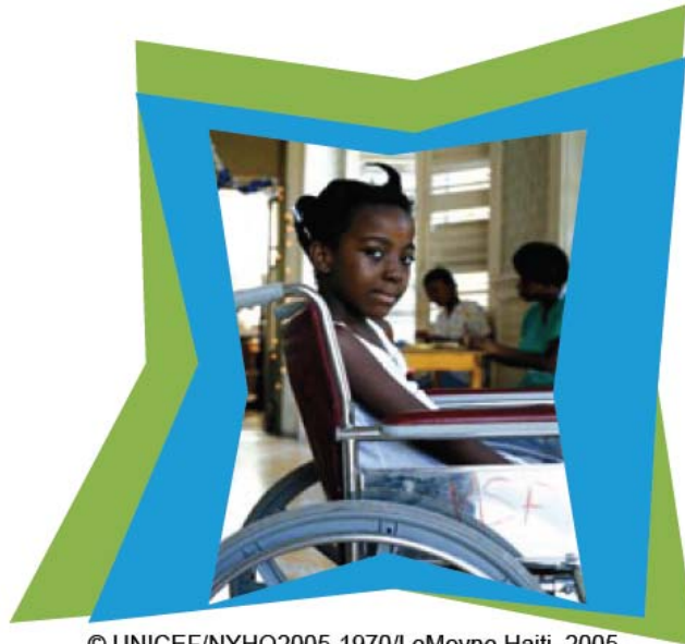
Haiti, 2005

Regarde bien la photo. Coche ci-dessous les phrases qui te paraissent vraies. Choisis les phrases qui décrivent « vraiment » la situation et écarte celles qui relèvent du préjugé.