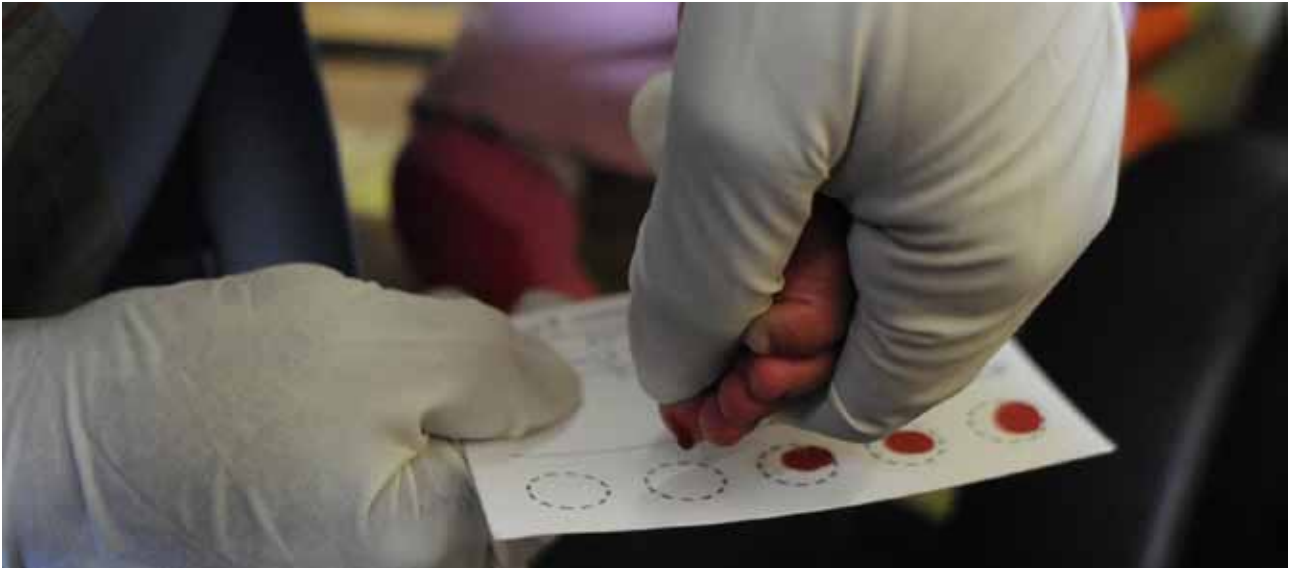
Un médecin prélève un échantillon de sang d'un enfant de 6 mois, à la clinique de Chelstone, en Zambie.