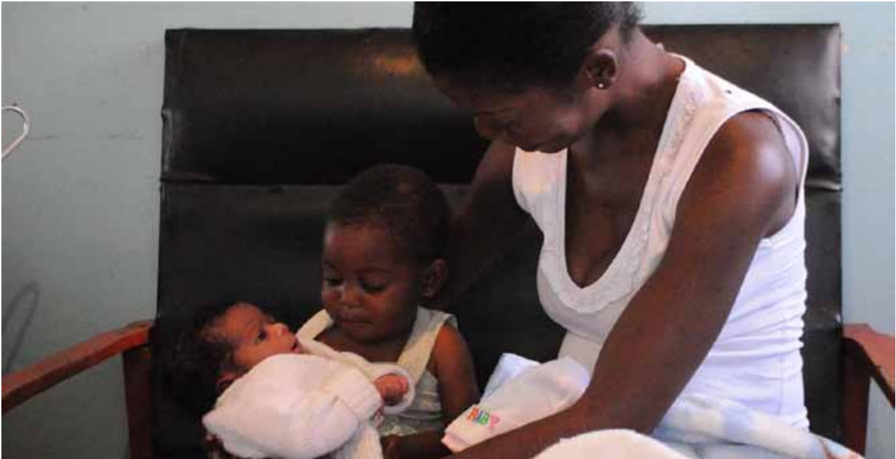
Une mère séropositive ayant suivi un programme de PTME entourée de ses enfants séronégatifs.

et à mettre en place des approches basées sur le genre et les droits pour une réponse durable et efficace en faveur des enfants affectés par le VIH/sida et tous les autres enfants vulnérables. Dans beaucoup de pays de la région, des partenariats stratégiques permettent d'atteindre des résultats pour les enfants, par exemple en RDC, un partenariat avec les partenaires sur le terrain du gouvernement des Etats-Unis pour soutenir les programmes de PTME et de traitements pédiatriques. Un partenariat très positif avec Unitaid permet de fournir du matériel pour la PTME et le sida pédiatrique au Cameroun, au Burkina Faso, en Côte d'Ivoire, en République Centrafricaine et au Nigéria.