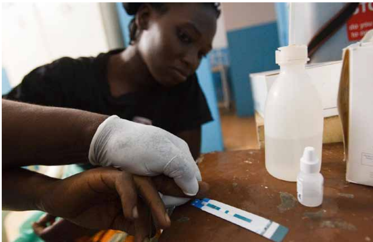
Test de dépistage lors d'une consultation prénatale en Côte d'Ivoire.

Ainsi, les politiques d'élimination de la transmission du VIH de la mère à l'enfant, de planification familiale et de prévention du VIH ne peuvent faire l'économie de la prise en compte du statut des femmes et des inégalités de genre afin de s'assurer que les filles et les femmes ont véritablement accès aux services de prévention et de soins materno-infantile et ne sont pas entravées par des facteurs socioculturels et de genre. Dans ce cadre, l'association des hommes aux programmes de PTME est essentielle, si bien que certains programmes parlent de l'élimination du virus des parents à l'enfant et non plus de la mère à l'enfant.