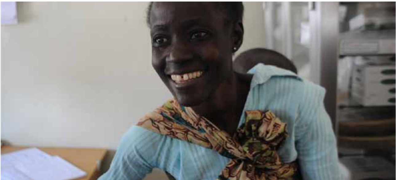
Cette mère séropositive apprend la séronégativité de son fils de 18 mois.