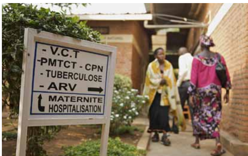
Un centre de conseil et de dépistage soutenu par l'UNICEF à Kigali, au Rwanda.

Comme l'appelaient de leurs vœux Anthony Lake, directeur général de l'UNICEF, et Desmond Tutu : « Les chiffres parlent d'eux-mêmes. À nous de faire un choix, à nous de fixer les priorités. C'est une question de vie ou de mort. Nous devons tous réaffirmer notre engagement à sauver des vies – en prenant des mesures audacieuses dès aujourd'hui pour libérer l'humanité du sida, en Afrique et partout ailleurs. »