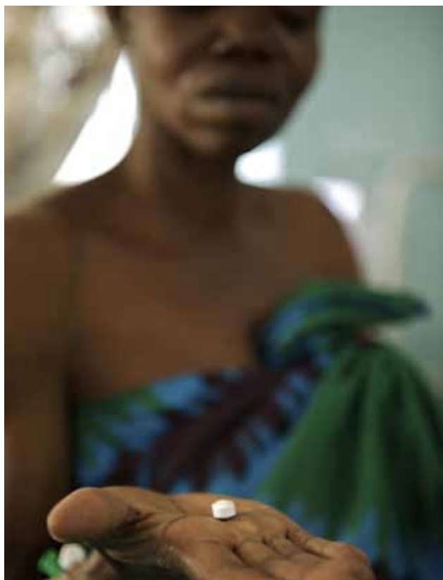
Dans un hôpital d'Ouganda, une femme séropositive prend un médicament antirétroviral (ARV), avant son accouchement.

La prévalence chez les adultes est estimée à 24,8 %, et elle grimpe à près de 33 % chez les femmes enceintes. Deux fois plus de jeunes femmes que de jeunes hommes vivent avec le VIH (11,8 % et 5,2 % respectivement).