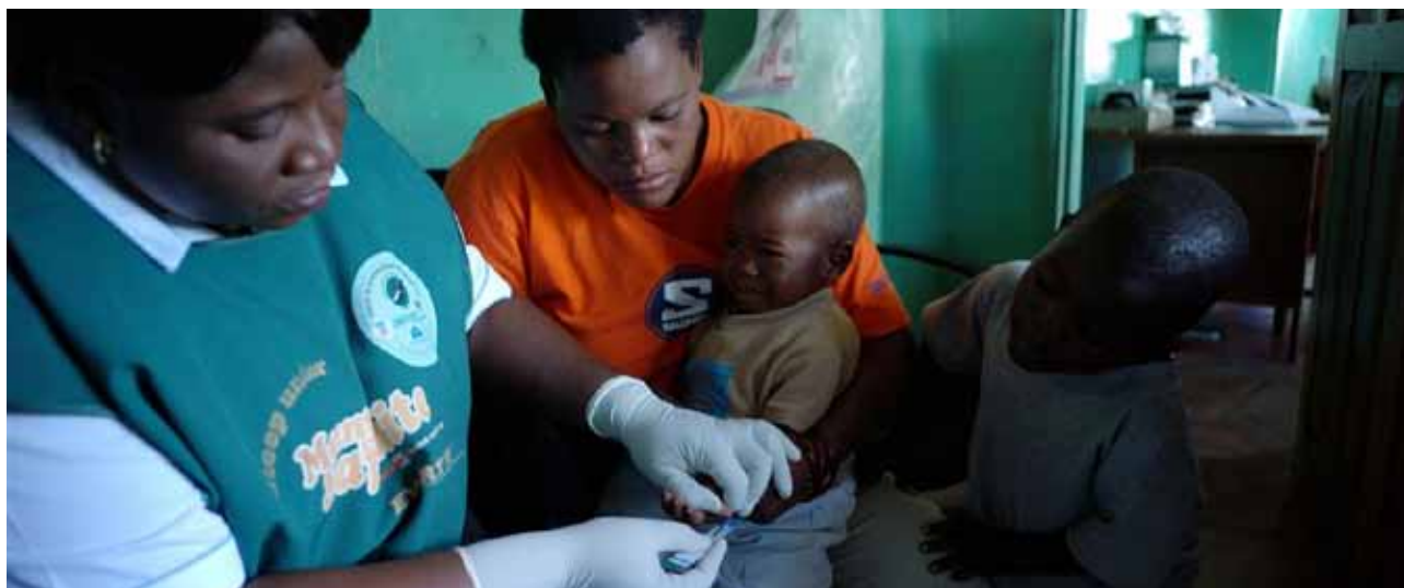
Une infirmière prélève un échantillon de sang d'un enfant de 18 mois, sur une bandelette de test VIH, en Zambie.

Les disparités à l'intérieur de la région sont visibles à plusieurs niveaux. Les pays qui profitent d'une stabilité économique, politique et sociale (Bénin et Ghana) ont réussi à mieux répondre au VIH/sida. Progressivement, ces pays commencent à décentraliser les programmes et à utiliser les ressources efficacement afin d'obtenir de meilleurs résultats pour les femmes et les enfants vivant avec le VIH/sida. A l'inverse, les pays qui ont dernièrement fait face à une crise politique ont vu leur réponse au VIH/sida affectée et fragilisée. C'est le cas par exemple de pays comme la République démocratique du Congo ou la Côte d'Ivoire.