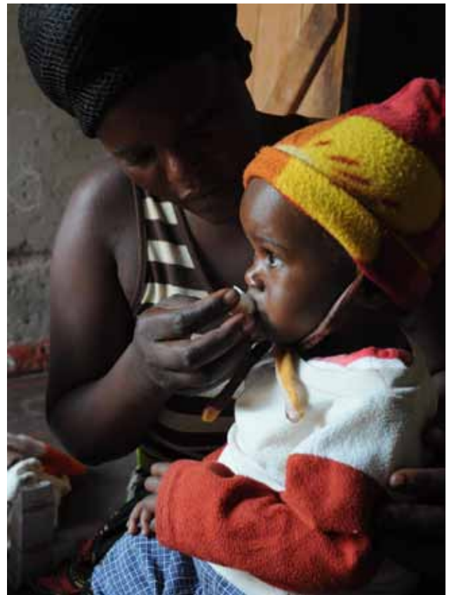
En Zambie, une mère séropositive donne à son fils une prophylaxie dans le cadre d'un programme de PTME.

Lorsque ces services sont mis à la disposition des femmes et de leurs enfants, ce risque de transmission peut être réduit à moins de 5 %.