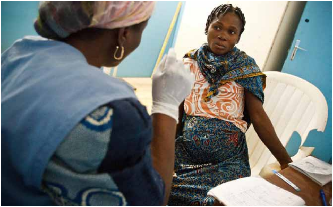
Dépistage lors d'une consultation prénatale à l'hôpital de Kani, en Côte d'Ivoire